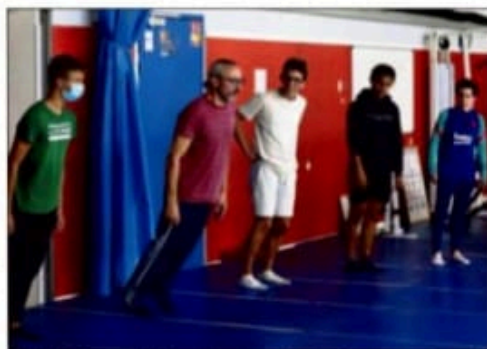
Michel Béjar en résidence de transmission de sept mois auprès des lycéens de Bristol. Le courrant passe immédiatement entre le chorégraphe et les élèves, ici de la première A.

Lycéens et chorégraphe, à raison d'un atelier par mois, entre octobre et avril, construiront une chorégraphie autour de la thématique de la discrimination et d'une figure emblématique de la